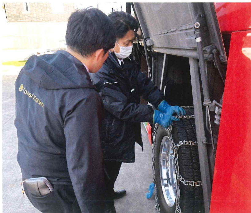
冬季チェーン訓練