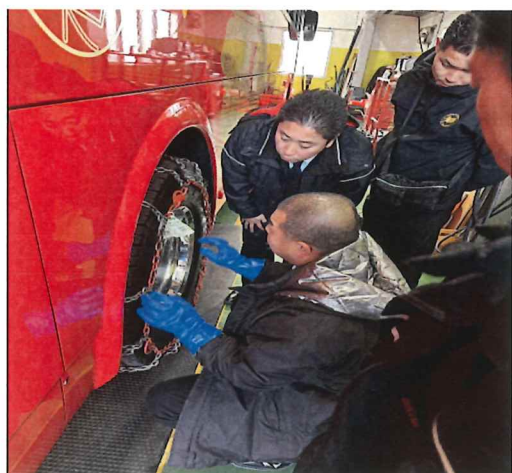
冬季チェーン訓練