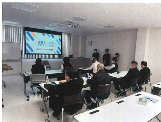
南関東日野自動車様：交通安全セミナー